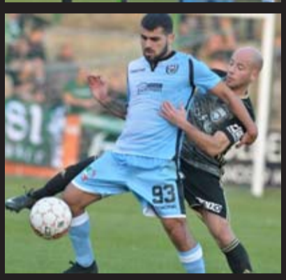
Le derby, qui s'est déroulé dans de très bonnes conditions « extérieures », a logiquement vu les Francs Borains s'imposer. Avec 7/9 au compteur, ils confirment leur bonne forme du moment et confortent leur position dans la colonne de gauche du classement.

A croire que les gardiens louviérois se sentent pousser des ailes quand ils affrontent le RFB ! Le week-end dernier, Cremers a empêché l'URLC de concéder sa première défaite de la saison. Et ce dimanche, c'était au tour de De Wolf de tout arrêter, ou presque, entre les perches de la RAAL. N'empêche, les Borains ont confirmé leur forme du moment.