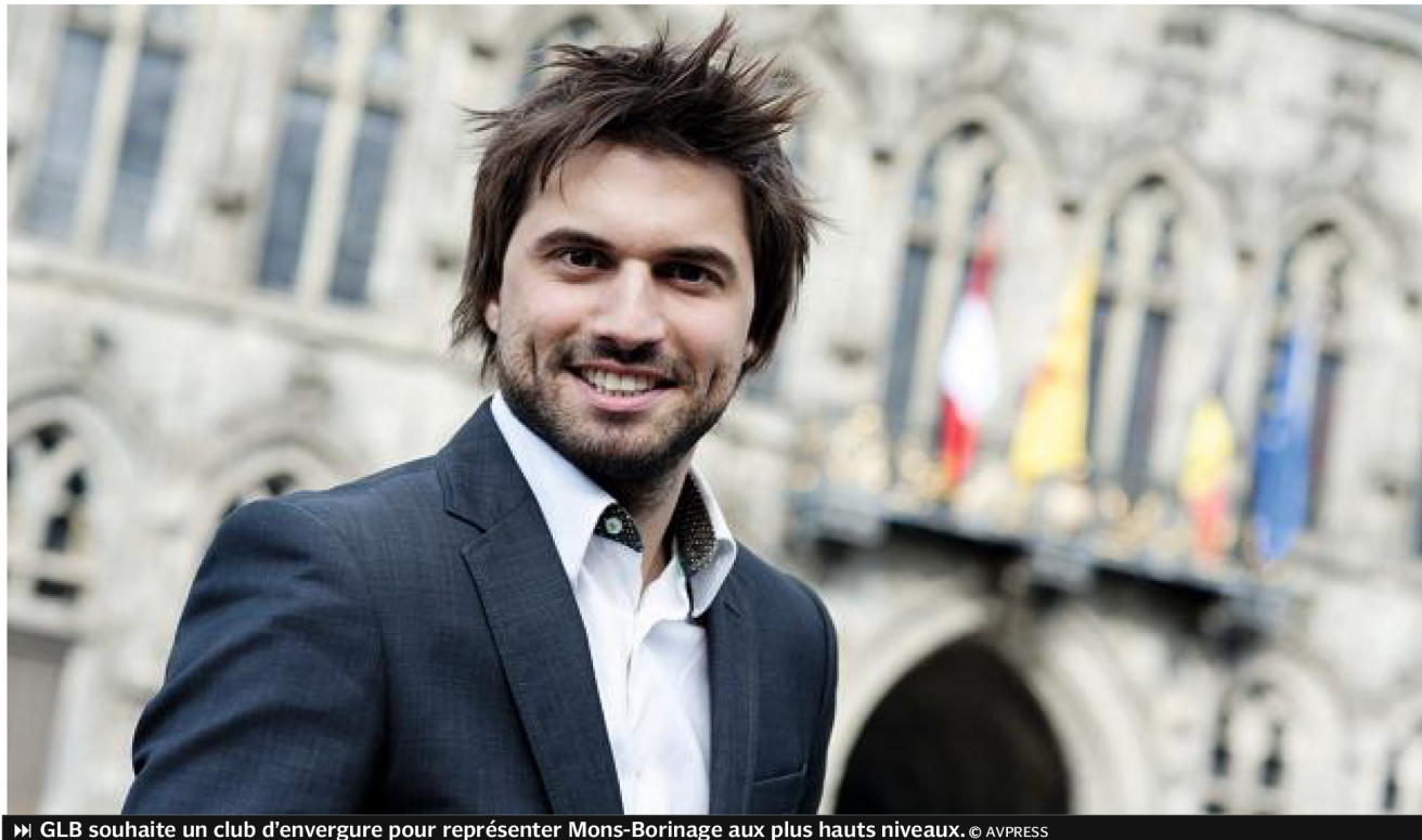
▶ GLB souhaite un club d'envergure pour représenter Mons-Borinage aux plus hauts niveaux.