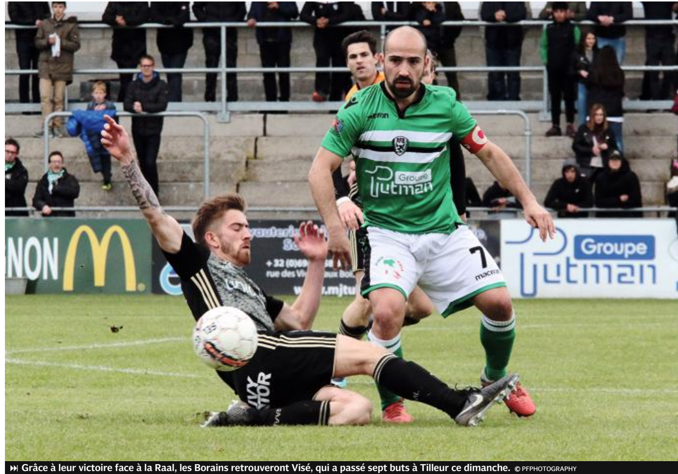
▶ Grâce à leur victoire face à la Raal, les Borains retrouveront Visé, qui a passé sept buts à Tilleur ce dimanche.

Taquin : “On reviendra ambitieux la saison prochaine.”