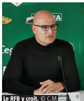
Le RFB y croit.

L'équipe anversoise jouera quant à elle à Anderlecht, ce dimanche. « J'y serai pour voir où se situe cette équipe. J'aurai en quelque sorte un rôle de visionneur. Il ne faut surtout pas oublier que la saison dernière, c'était l'une des